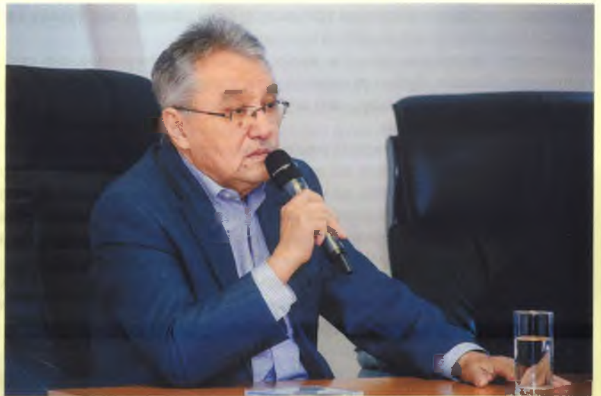
Өлді деуге болама айтыңдаршы, Өлмейтұғын артына сөз қалдырған. Ибаһим Құнанбайұлы